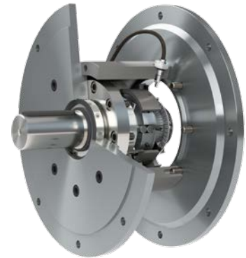
EAS ® -reverse in Gehäuse mit genormten Standardabmessungen