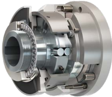
EAS ® -reverse mit gelagertem Flansch zum direkten Anbau von Antriebselementen