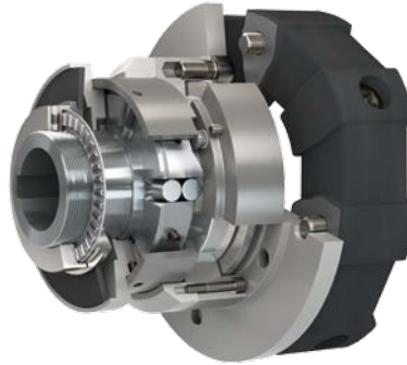
EAS ® -reverse Zweiwellausführung mit elastischer, formschlüssiger Kupplung